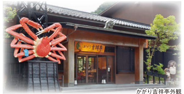
かがり吉祥亭外観

ようこそ、加賀・山中温泉へ。 この湯のまちには、日本の心と、四季の自然の美しさと、 金沢の奥座敷として磨かれた豊かな伝統文化が満ちています。 ただ温泉につかるだけではなく、この温泉郷に受け継がれた 日本の心に、ゆったりとつかりにきてください。