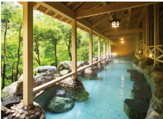
露天風呂