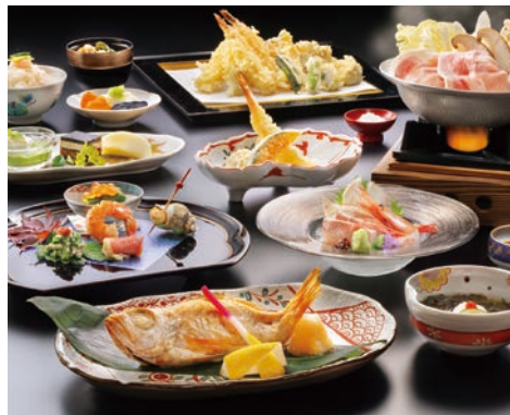
のどぐろ・能登豚・天婦羅自慢会席